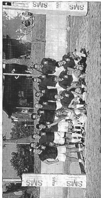
La formazione di San Marino Città

SAN MARINO - Nell'ambito della Festa dello Sport di Chiesanuova, patrocinata dalla locale Giunta di Castello, si è svolto sabato 19 il secondo Campionato Sammarinese di Rugby. In palio la "Coppa della Federazione". A disputarsela quattro squadre in rappresentanza di altrettanti Castelli della Repubblica: Chiesanuova, Faetano, San Marino Città e Serravalle, campione uscente. Questi i risultati degli incontri del girone preliminare: Città-Serravalle = 12-10, Chiesanuova-Faetano = 14-7, Città-Chiesanuova = 10-0, Serravalle-Faetano = 15-7, Serravalle-Chiesanuova = 21-7 e Faetano-Città = 7-5. Finalissima molto combattuta tra Città e Serravalle, che vede Città alla fine mar-