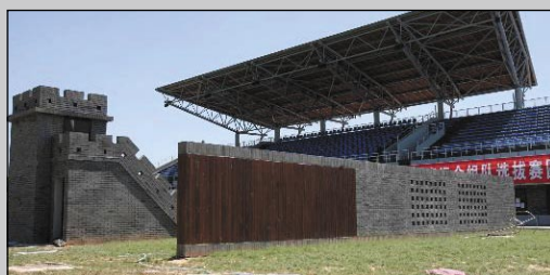
La BJ Shooting Range CTF (tiro a volo)