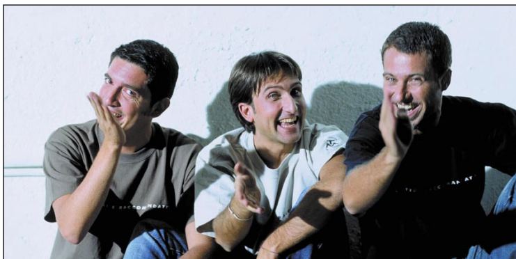
Il Trio Medusa dalle 18 alle 20 sarà in piazzetta del Faro

Sarà proprio il Trio Medusa a salire la scala arancione che porta al Summer Studio di viale Ceccarini e guidare l'Happy Hour di Radio Deejay. Il trio più irriverente della televisione italiana coinvolgerà con la solita verve coloro che passeggiaran-