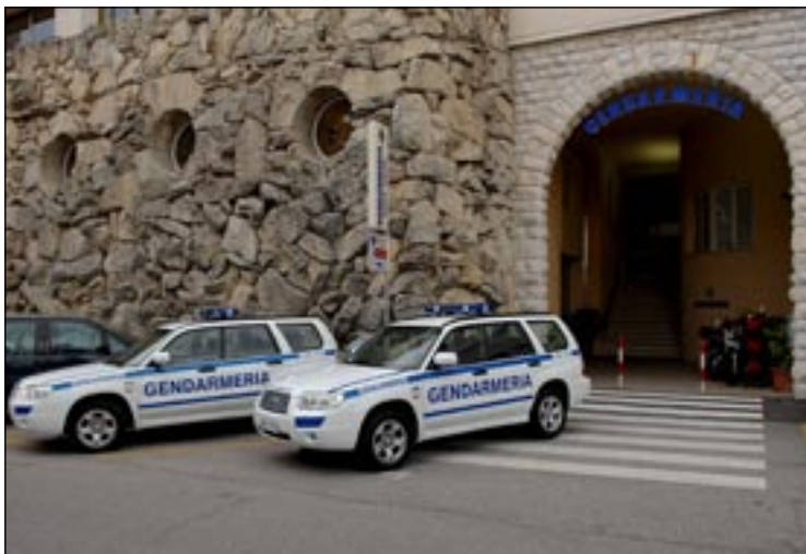
Gendarmi sul piede di guerra: "Stanchi dei doppi turni, servono uomini"

Le scorte quotidiane ai portavalori bloccano i normali servizi e cresce la tensione: "C'è una carenza esagerata di personale. Distribuire gli impegni tra i vari Corpi non è la soluzione"