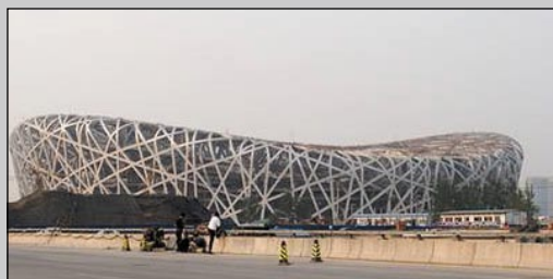
Il National Stadium (cerimonie e atletica)