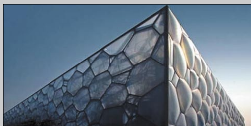
Il National Aquatics Centre (nuoto)