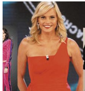
L'ammaliante Simona Ventura

sketch visti alle lene, vero spauracchio di politici e vips, il Trio Medusa nasce per gioco quando i tre ragazzi (insieme ad un quarto amico) trascorrevano le vacanze estive presso la stessa località balneare. Ma il week end riccionese regala un'altra chicca. Si tratta di un evento in cui il pubblico è il vero protagonista. Oggi e domani, infatti, si terranno dalle 12 alle 23 in piazzale Roma le selezioni ufficiali del "L'isola dei famosi 6", il reality show più seguito della televisione italiana che anche quest'anno verrà condotto da Simona Ventura ed andrà in onda da settembre su RaiDue. Oltre infatti ai più famosi protagonisti, fra cui si conoscono già i nomi di Giucas Casella, Massimo Ciavarro, il nuotatore Leonardo Tumiotto, l'ex velina